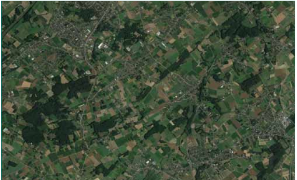
Fig. 1 - Overzichtkaart van het werkgebied

Klinkt dit je aangenaam in de oren? Vraag je je af waar deze plek zich bevindt of zou kunnen verwezenlijkt worden? Dichterbij dan je denkt! Op de grens van Merelbeke en Oosterzele loopt de Driesbeek. Een vrij smalle waterloop die ontspringt in de Makegemse bossen, het (grotendeels agrarisch) landschap doorkruist, doorheen de bosrijke Bottelaarse vijvers vloeit, stroomafwaarts samen met de Molenbeek overgaat in de Gondebeek en dan doorheen het Aelmoeseneiebos verder zijn weg zoekt richting Melle en de Schelde.