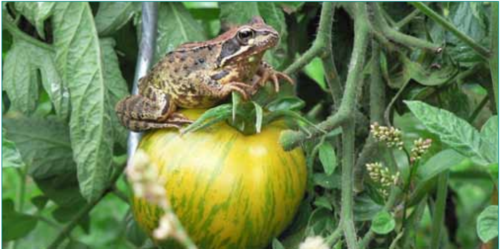
Kikker op tomaat