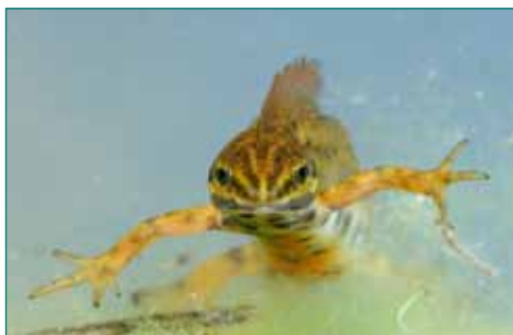
Kleine watersalamander