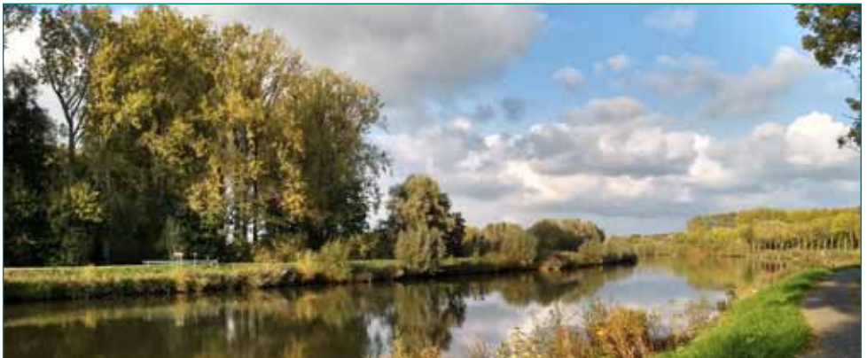
De Schelde in Merelbeke