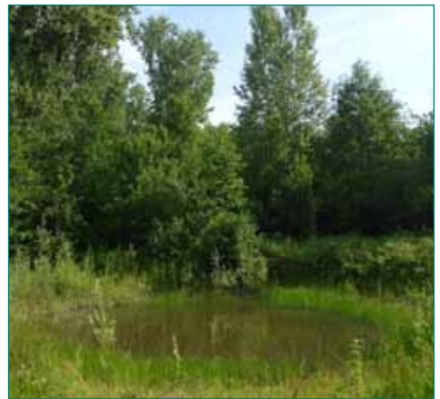
Toppoel in Merelbeke

Maar er is meer. De kamsalamander mag dan wel de ambassadeursoort zijn van het poelenplan, ook alle andere soorten amfibieën zitten mee in de lift. Zo is Merelbeke de enige gemeente in Vlaanderen waar de vijf inheemse salamandersoorten in één en dezelfde poel voorkomen: vuursalamander, alpenwatersalamander, kamsalamander, vinpoot- én kleine watersalamander in eenzelfde poel. Merelbeke telt vijf zulke poelen, waarvan er twee werden aangelegd in uitvoering van het poelenplan.