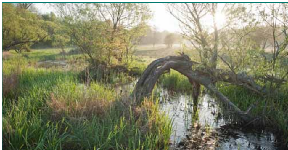
Fig. 4 - Sfeerbeeld van de Driesbeekvallei

Ambitieuze doelstellingen, grootse verwachtingen; de samenwerkingsovereenkomst omvat veel meer dan enkel een regionaal bos. Het ganze landschap wordt aangepakt en er zal worden gestreefd naar een globale benadering om vanuit verschillende invalshoeken en met meerdere actoren en partners de doelstel-