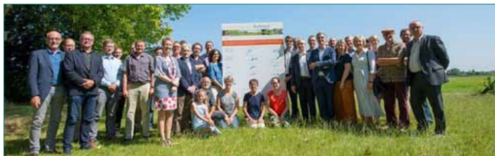
Fig. 3 - Ondertekening samenwerkingsovereenkomst

Eénmaal de nieuwe telg gezond is bevonden door de experts, alle vaccinaties ge-