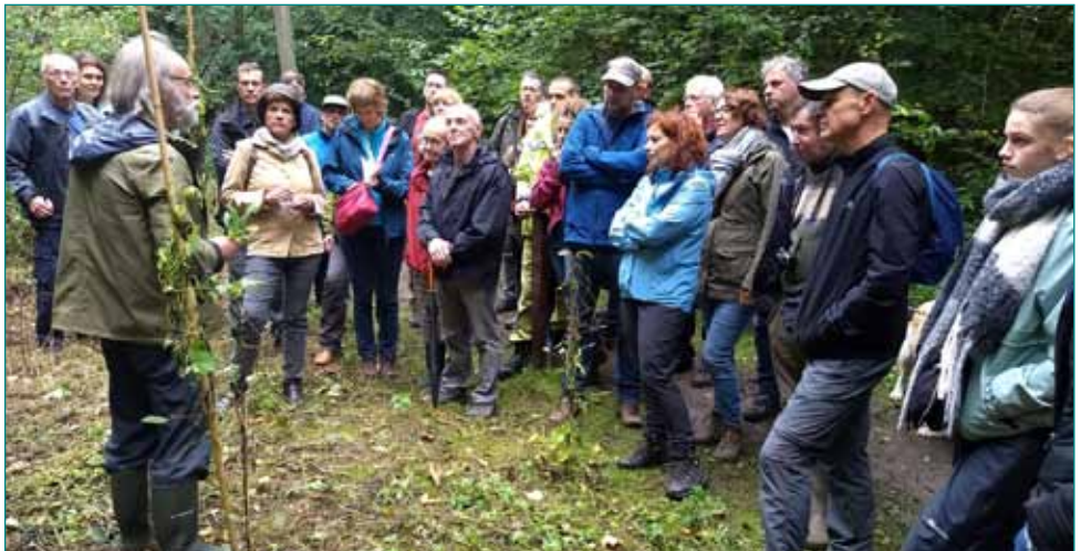
Wandeling eetbare natuur