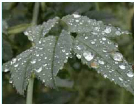
Humusatie brengt leven