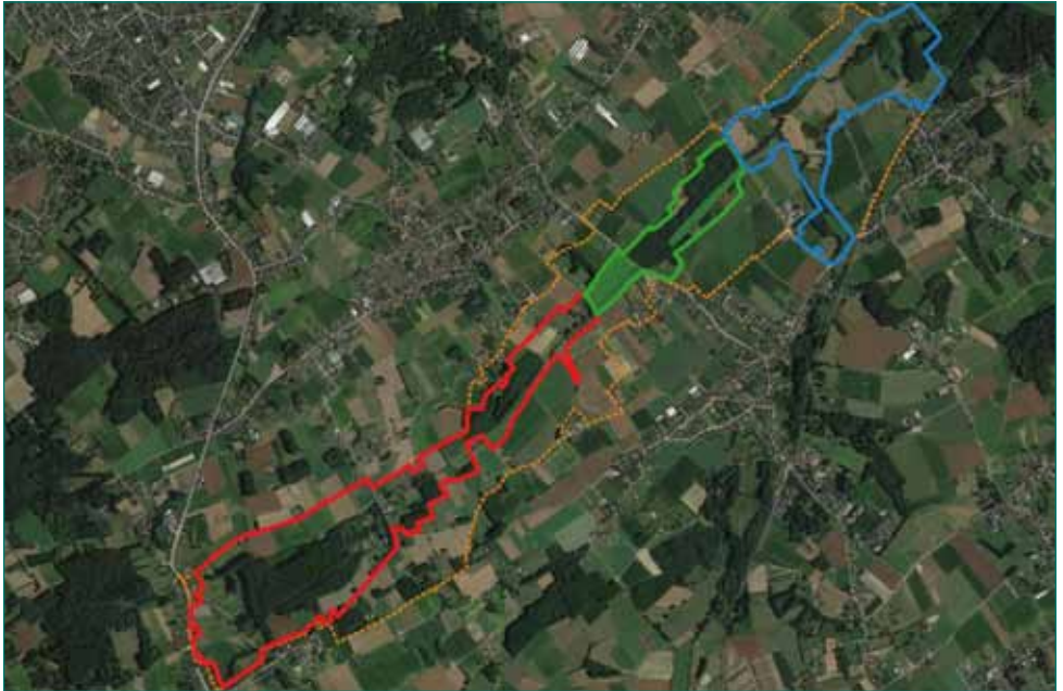
Fig. 2 - Gedetailleerde kaart van de Driesbeek en Gondebeek. Blauw, Gondebeek (perimeter natuurpunt Oosterzele; groen, Bottelaarse vijvers (perimeter ANB); rood, Driesbeek (perimeter Natuurpunt Boven-Schelde en Oosterzele)

Aangezien de Driesbeek grosso modo de grens vormt tussen Oosterzele en Merelbeke, en dus gedeeltelijk binnen het werkingsgebied van Natuurpunt Boven-Schelde valt, was het een logische stap dat beide afdelingen de handen in elkaar slaan en gezamenlijk een project uitwerken. Aldus geschiedde en sinds kort (eigenlijk al ettelijke maanden) zijn we samen begonnen met het zoeken naar mogelijkheden voor natuurontwikkeling en het uitwerken van natuurinrichtingsplannen in de Driesbeekvallei tussen de Makegemse bossen en het Aelmoeseneiebos (Fig. 2). Een perimeter werd afgeba-