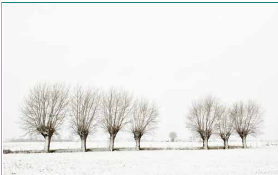
Knotwilgenrij in de sneeuw