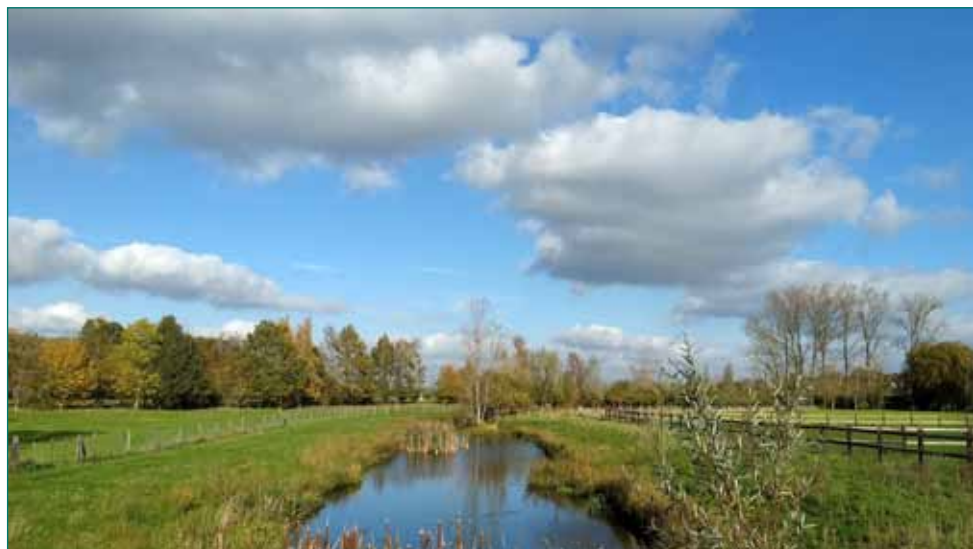
Scheldemeersen aan de Brandegemse Ham