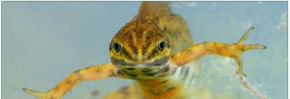
Kleine watersalamander