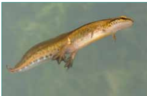
Kleine watersalamander